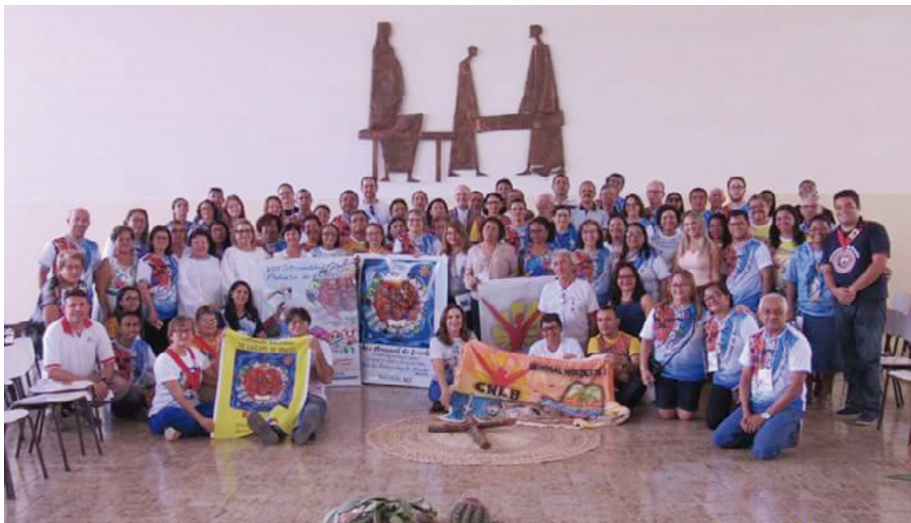
Participantes da VIII AGO do CNLB NE2.

“O grande legado do Ano Nacional do Laicato será a consciência da missão laical transmitida através de momentos de Formação”.